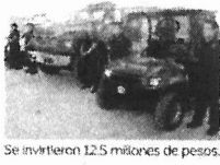
Se invirtieron 12.5 millones de pesos.

El recinto cuenta con áreas jurídicas de inspección, sala para capacitaciones, dormitorios, comedor y un estacionamiento para siete camiones.