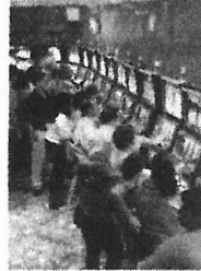
Casinos en Monterrey

Por esa razón, expresamos que es responsabilidad y privilegio de los diputados locales de Nuevo León revertir la actitud discriminatoria, la ausencia de diálogo con las damas y caballeros de la tercera edad que encuentran en los casinos... y que ahora son desahogados del 10 por ciento de su presupuesto destinado para ese momento de esparcimiento al que tienen