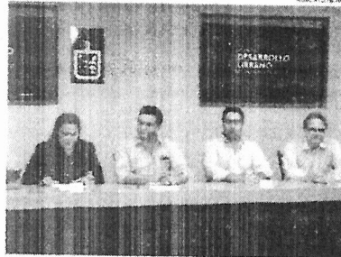
Proyectan nuevo sistema de movilidad sustentable.

Uno de los objetivos es que los habitantes del municipio se queden a trabajar en la zona