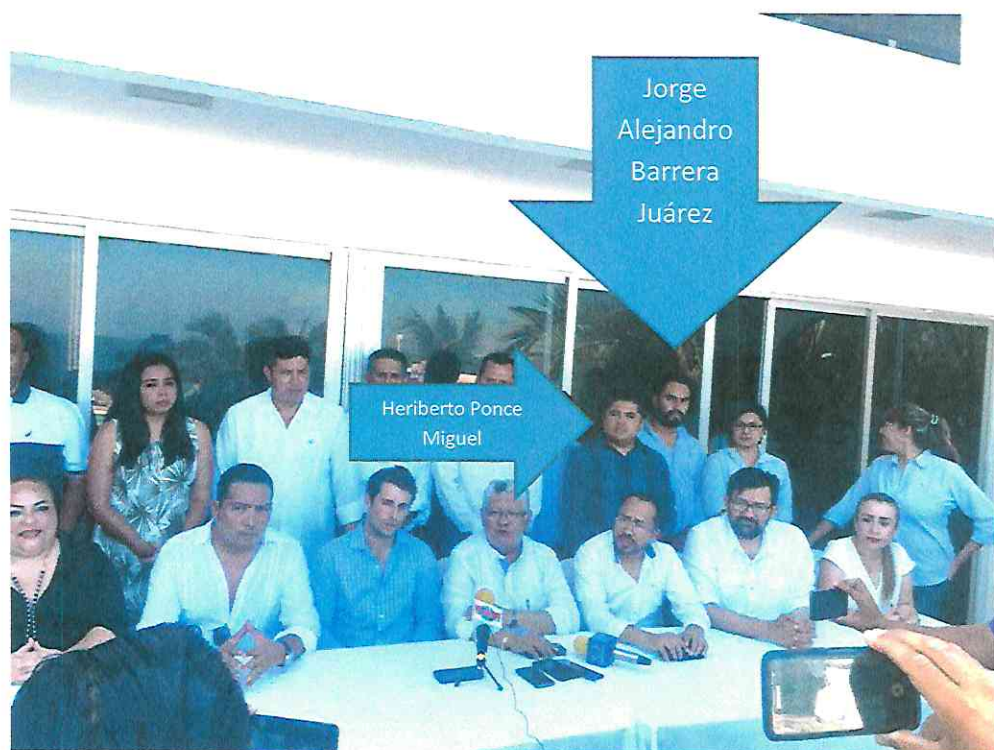
Fotografía relativa a la rueda de prensa en la ciudad de Boca del Río, Veracruz, llevada a cabo el día once de agosto de 2019.

Los hechos denunciados resultan violatorio de lo previsto en el artículo 59 del Reglamento de Órganos Estatales y Municipales del Partido Acción Nacional y 26 de la Convocatoria a la , el cual establece que los órganos del Partido en cada entidad, deberán garantizar el desarrollo de todas las campañas bajo condiciones de equidad, sin privilegiar a ningún candidato, que el incumplimiento dará lugar al inicio del procedimiento correspondiente; en tal sentido se denuncias