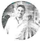
Paco Mota @pacomotaq